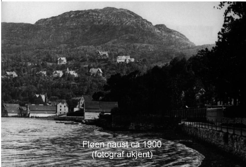
Fløen naust ca 1900